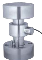
Kit de plaques- Plates kit