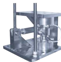
Stabican 200 t